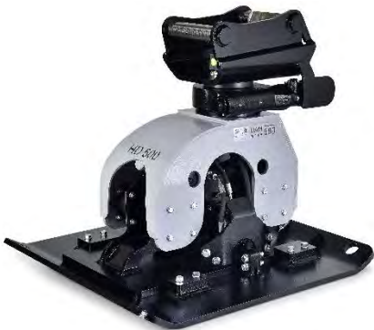
Abb. inkl. optionaler Verbreiterungsplatte

Die UAM proline Anbauverdichter erhalten ein noch umfangreicheres Einsatzgebiet durch die Verwendung von folgendem optionalem Zubehör: